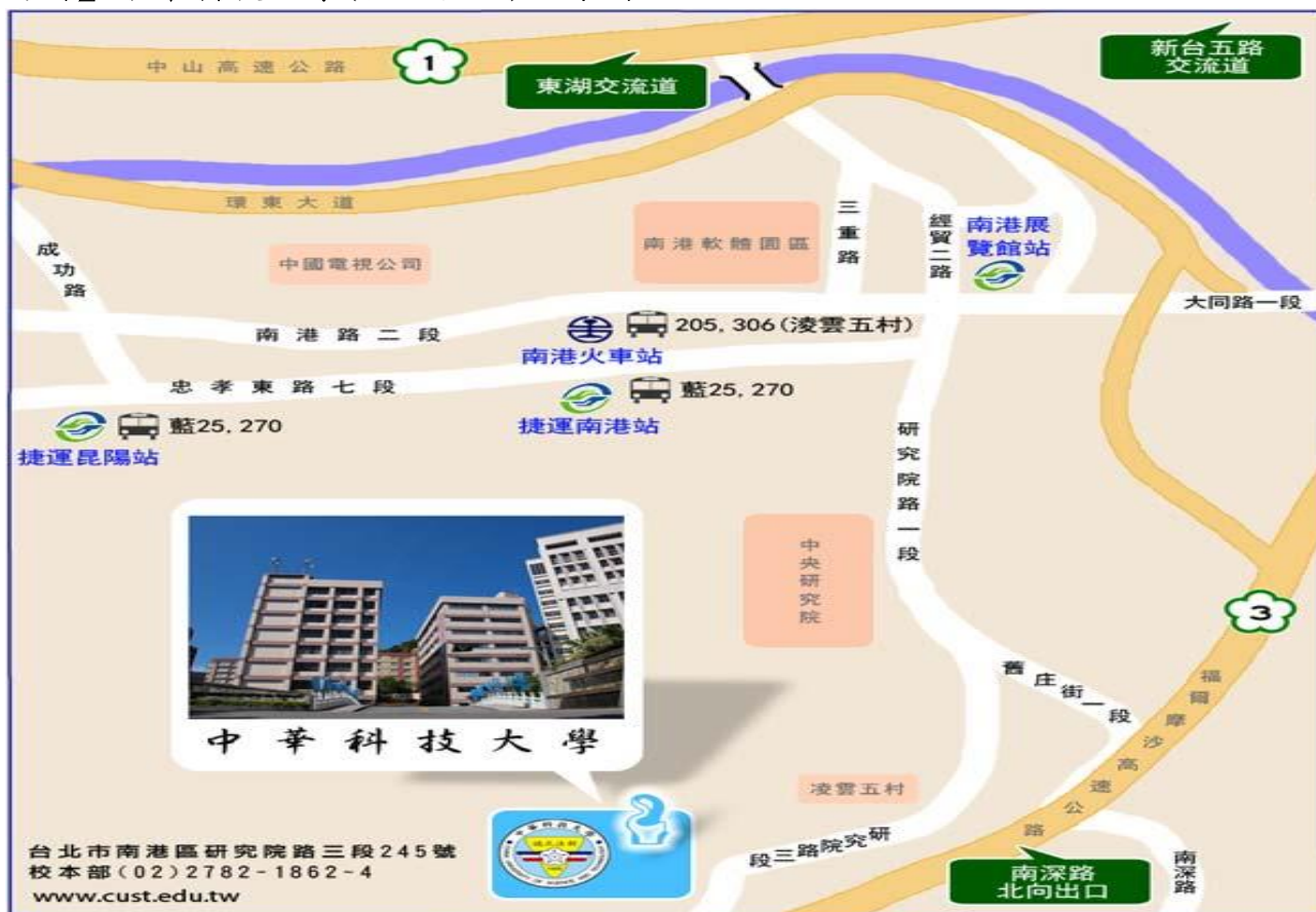
【附圖】中華科技大學(台北校區)路線圖